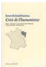
CRISI DE L'HUMANISME ER. CURTIUS TRADUCCIÓ DE MARC JIMÉNEZ ELAGEMINADA 380 PÀG./18 €

Edicions de la Ela Geminada, una d'aquestes magnífiques microeditorials que estan florint en aquests temps convulsos, ha apostat per la recuperació de textos valuosos. És d'agrair que a la pàgina web, en la pestanya d'autors, hi apareguin a sota els traductors. I de fet, es nota en la qualitat de les traduccions