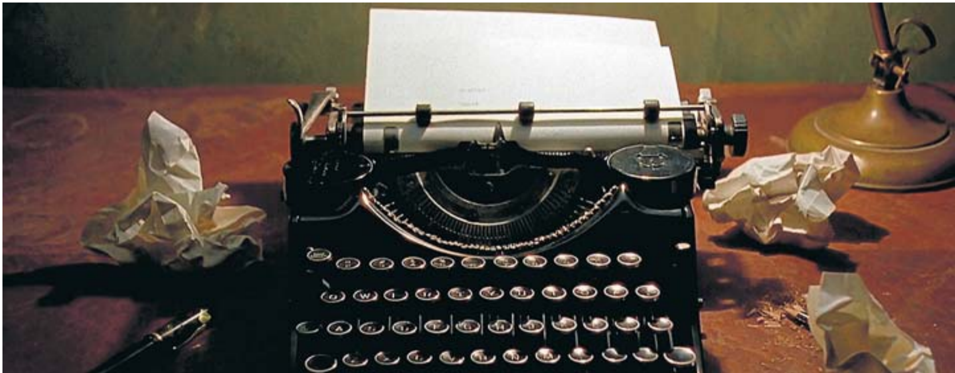
BARTON FINK, DELS GERMANS COEN, TAMBÉ ESTAVA OBSEDIT PER L'ESCRITURA